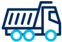
Equipo de Contratistas