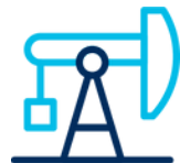
Oil & Gas