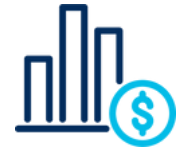
Líneas financieras y profesionales