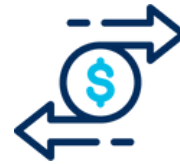
Dinero y Valores en Tránsito