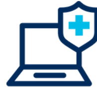
Cyber Risk & E-commerce