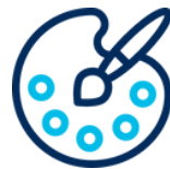
Obras de Arte