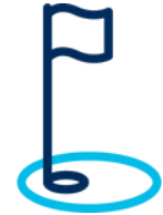
Hole in One Contingency