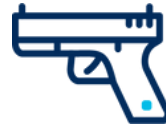
Robos y Asaltos