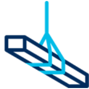
Construction All Risk