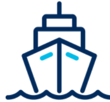
Transportes y Riesgos marítimos